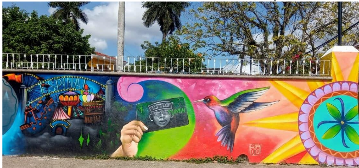
En las bardas del parque se ha sido incluido el Tumin como parte de la identidad local.