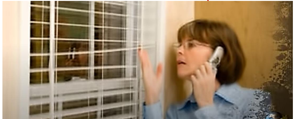
.6. Vigilancia masiva: policia unos de otros.