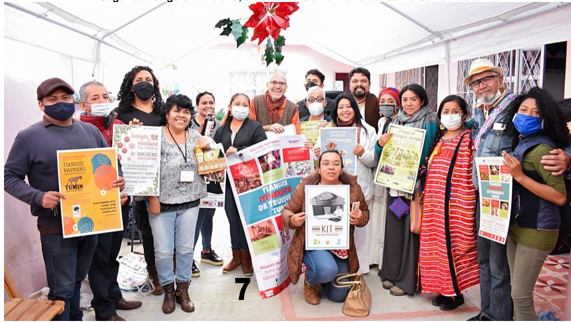
Segundo tianguis navideño, en la Plaza Comunitaria del barrio Santa Lucía

* Con información de Marco Turra (Oaxaca) y Gustavo Castro (Chiapas). FB: Tumin San Cristóbal.