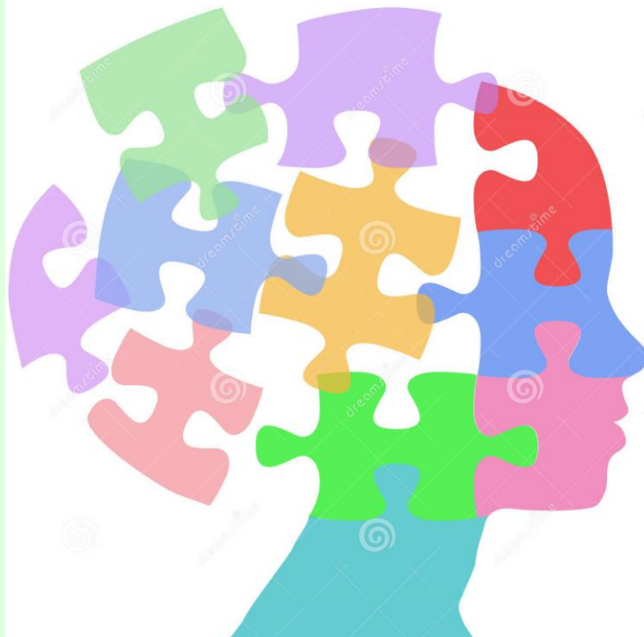
Procuraba que la gente descubriera la verdad.

Nada podría ser menos autoritario que las parábolas de Jesús. Toda su finalidad consiste en hacer posible que el oyente descubra algo por sí mismo. No se trata de ilustraciones o de doctrinas reveladas, sino de obras de arte que revelan o desvelan la verdad acerca de la vida. Suscitan en el oyente la fe, de modo que éste pueda 'ver' la verdad por sí mismo. 12 Por eso las parábolas de Jesús concluyen siempre con un interrogante explícito o implícito que el oyente debe responder personalmente: «¿Quién de estos tres te parece que demostró ser prójimo?» (Lc 10, 36); «¿Quién de ellos le amará más?» (Lc 7, 42); «¿Qué os parece? ¿Cuál de los dos hizo la voluntad del padre?» (Mt 21, 28, 31); «¿Qué les hará, pues, el amo de la viña?» (Lc 20, 15). Las parábolas de la oveja y la dracma perdidas están formuladas casi enteramente como preguntas (Lc 15, 4-10; Mt 18, 12-14).