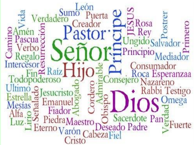
No le gustaban los títulos.

No hay en Jesús el menor rastro de miedo. No le asustaba originar un escándalo, o la pérdida de su reputación y hasta de su vida. Todos los hombres religiosos, incluido Juan el Bautista, se escandalizaban del modo que tenía Jesús de mezclarse socialmente con los pecadores, de cómo parecía disfrutar de su compañía, de su tolerancia respecto a las leyes, de su aparente indiferencia por la gravedad del pecado y de su franca y natural manera de tratar a Dios. No tardó, pues, en adquirir una mala reputación: «Ahí tenéis a un comilón y un borracho» (Mt 11, 16-19). Desde el punto de vista de la solidaridad de grupo, su amistad con los pecadores permitía clasificarle como un pecador más (Mt 11, 19; Jn 9, 24). Su amigable trato con las mujeres, y en especial con prostitutas, habría bastado para arruinar cualquier resto de buena reputación que todavía pudiera conservar (Lc 7, 39; Jn 4, 27). Jesús no hacía ni se comprometía con nada que