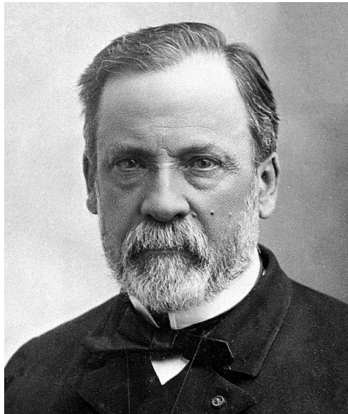
Luis Pasteur, defraudador