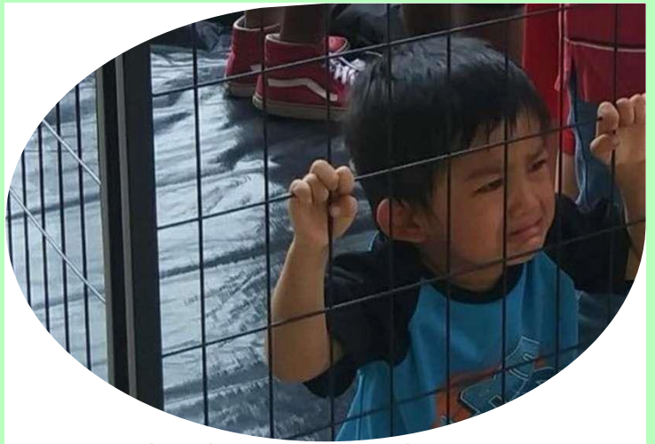
Jesús salió en defensa de los más vulnerables.

Pero el niño que constituye la imagen del Reino es un símbolo de quienes ocupan los más ínfimos lugares en la sociedad, los pobres y oprimidos, los mendigos,