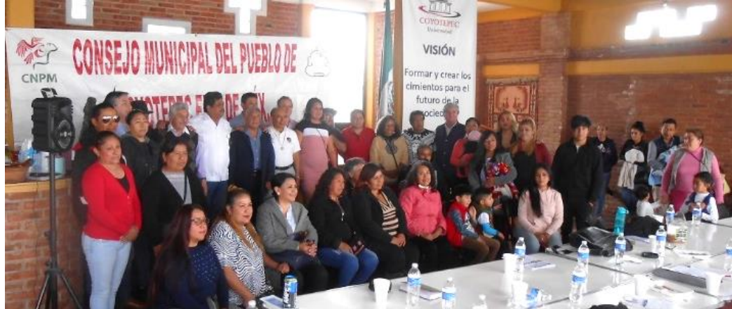
Asamblea del CNPM en Coyotepec, Edomex

El tigre puede quedarse y ser domado; lo que debería desaparecer, es la lotería, ésa sí hace mucho daño. ▀