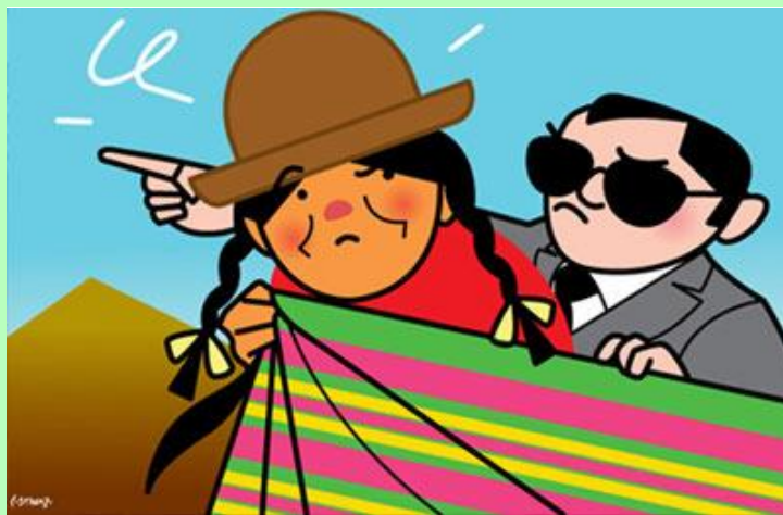
Las más despreciadas, por ser mujeres, por ser pobres por ser indígenas, y por ser niñas.

«Los que se humillan serán exaltados» no es ninguna promesa de un futuro prestigioso para aquellos que no lo tienen actualmente o han abandonado toda confianza en el mismo. Es, más bien, la promesa de que ya no serán tratados como inferiores, sino que serán plenamente reconocidos como seres humanos. Así como no se promete a los pobres la riqueza, sino la