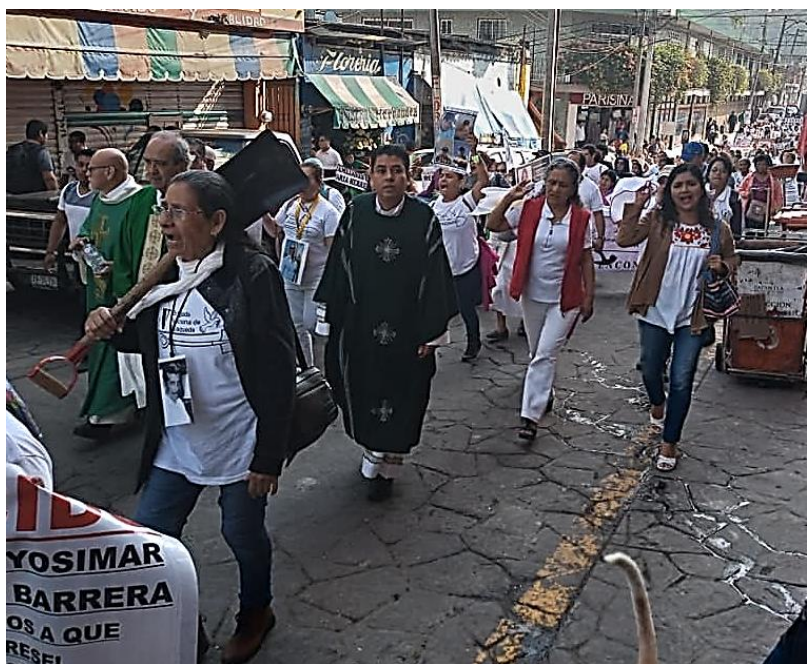
Caminata por la paz, Papantla, Veracruz.

Para el 21 de febrero a las 11:00 hrs. se tiene programada la caminata de la esperanza y oración por la paz desde el parque Benito Juárez hacia la plaza cívica 18 de marzo en Poza Rica, Veracruz. ▲