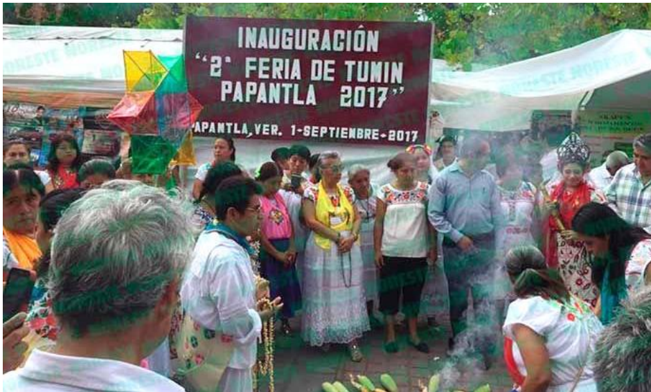
Ceremonia al estilo de nuestros pueblos originarios.

Papantla, Ver.- Con más de 60 expositores se llevó a cabo la 2ª Feria del Túmin Papantla 2017, “Un Túmin en el Bolsillo”, del 1 a 3 de septiembre en el parque central de esta ciudad. Acudieron compañeros de otros estados, principalmente de Oaxaca y Puebla, así como de diversos municipios del Totonacapan, al norte de Veracruz, recibidos por la hospitalidad de los artesanos papantecos, quienes les invitaron comidas preparadas por ellos mismos durante los tres días.