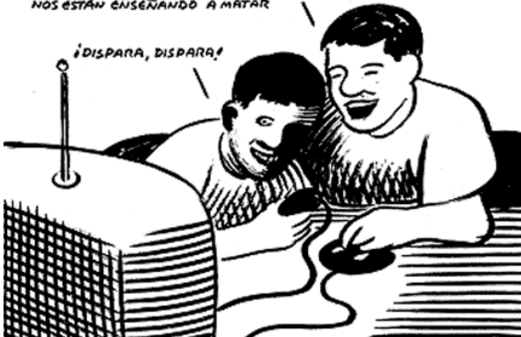
Educación para la violación de derechos humanos

LO LLAMAN VIDEOJUEGOS, PERO YO CREO QUE NOS ESTÁN ENSEÑANDO A MATAR